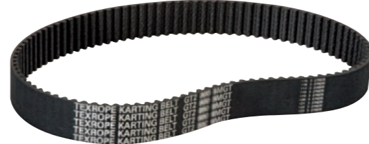
Zahnriemen 30 mm Breite

0510102, 0510202, 0510203, 0510204 und 0510999