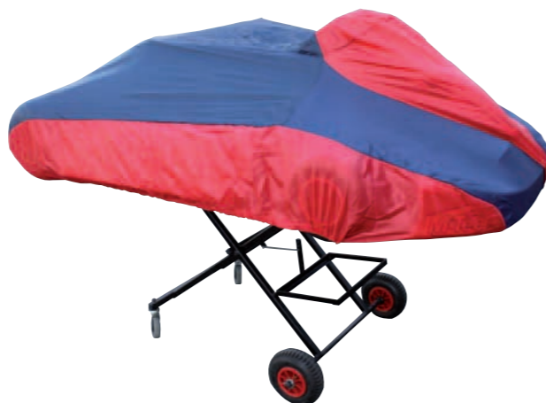
Kartgarage rot mit Lenkradtasche