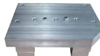
Motor Schiebebock 270-390cc Motoren