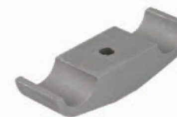
Motorbockklemme 32 mm