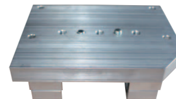
Motor Schiebebock 160-200cc Motoren